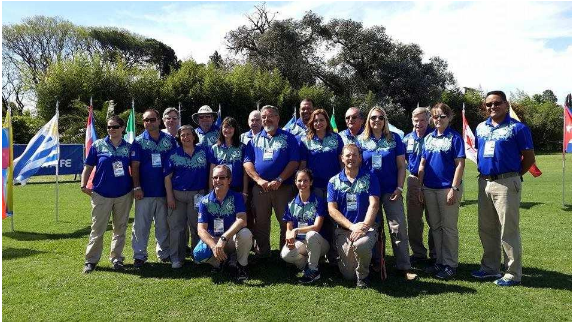
The judges at the 2014 Pan American Championships in Rosario, Argentina