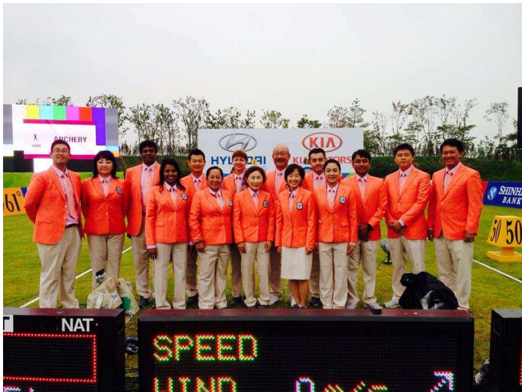
The Judges at the 2014 Asian Games in Korea